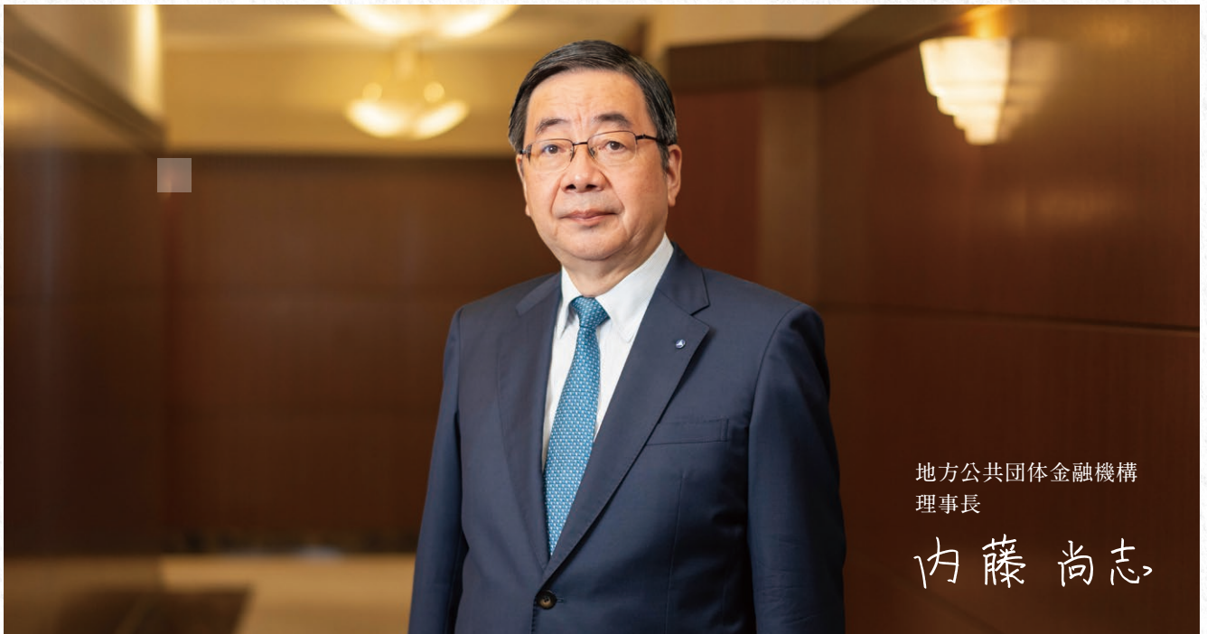
地方公共団体金融機構 理事長