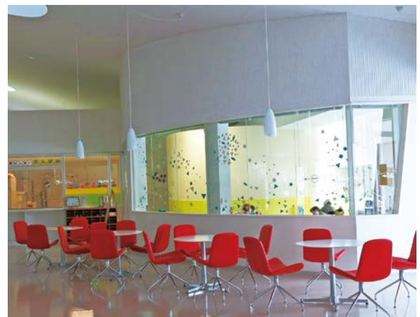
子育て支援センター