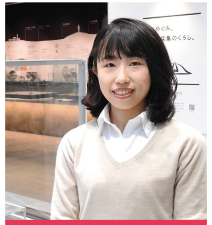
能美ふるさとミュージアム 学芸員

当館は、能美市の魅力を詰め込んだ総合博物館です。ここで学んだ知識を活かして、実物の古墳や自然に触れていただき、能美という地域を楽しんでもらえればうれしいです。