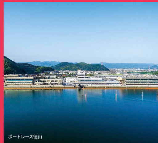
ポートレース徳山