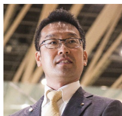
森中 高史 守山市長

1979年生まれ。東京大学法学部卒業後、2002年総務省入省。総務省（地方財政、地方税制、自治体DX、消防防災等）のほか、首相官邸や公営企業金融公庫へ出向。自治体は、守山市や滋賀県のほか、秋田県や岡山県へ出向。一昨年総務省を退職し、昨年2月より守山市長。