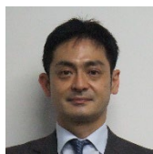
モデレーター 羽白 淳 政策研究大学院大学 教授

1979年生まれ。東京大学法学部卒業後、2002年総務省入省。総務省（地方財政、地方税制、自治体DX、消防防災等）のほか、首相官邸や公営企業金融公庫へ出向。自治体は、守山市や滋賀県のほか、秋田県や岡山県へ出向。一昨年総務省を退職し、昨年2月より守山市長。